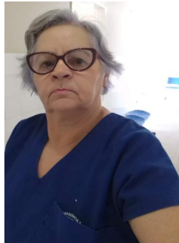
Paizinha Hospital M.L.Gomes