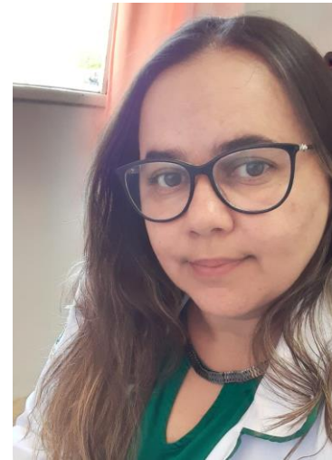
Consuêlo Hospital M.L.Gomes