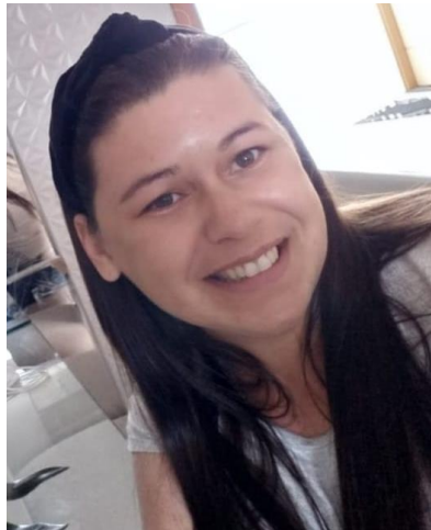
Elanine Assistência Social